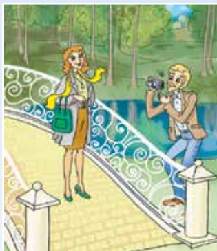
Misha's mother and father